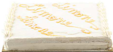
Immagine a scopo illustrativo