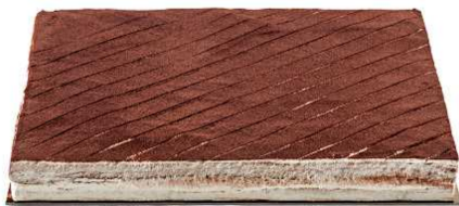
Immagine a scopo illustrativo