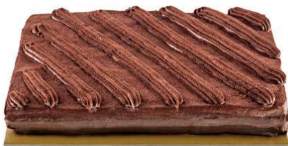
Immagine a scopo illustrativo