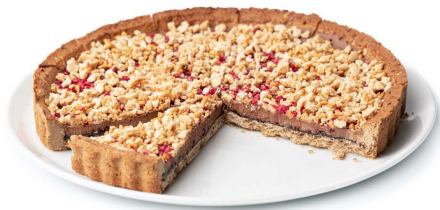
Immagine a scopo illustrativo